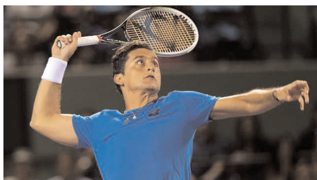
AS: IGRAM LOKALNO