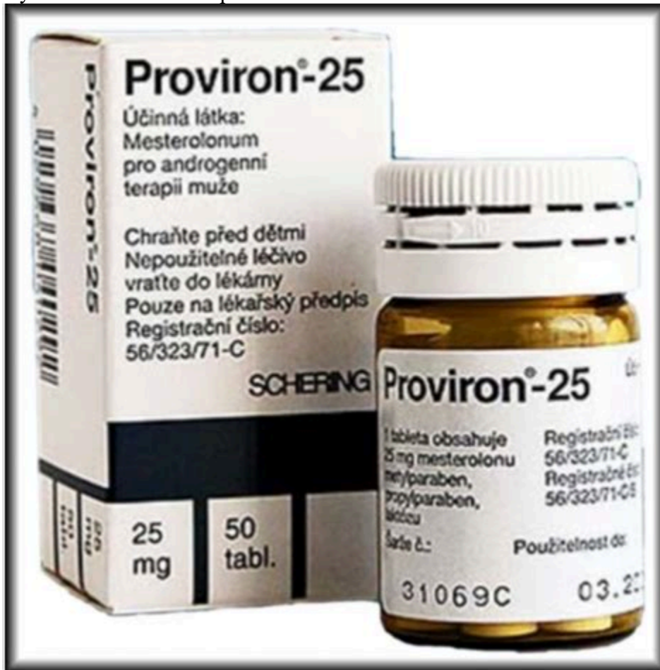
Winstrol Oral Estanozolol.

inclinación marginalmente más excelente para el desarrollo muscular que. El estanozolol se encuentra tanto en forma inyectable como en pastillas, ambas presentaciones producen exactamente el mismo resultado. El inyectable tiene una duración media de hasta 48 horas en la sangre, por lo tanto, debería ser inyectado en dos días separados a la semana como mínimo.