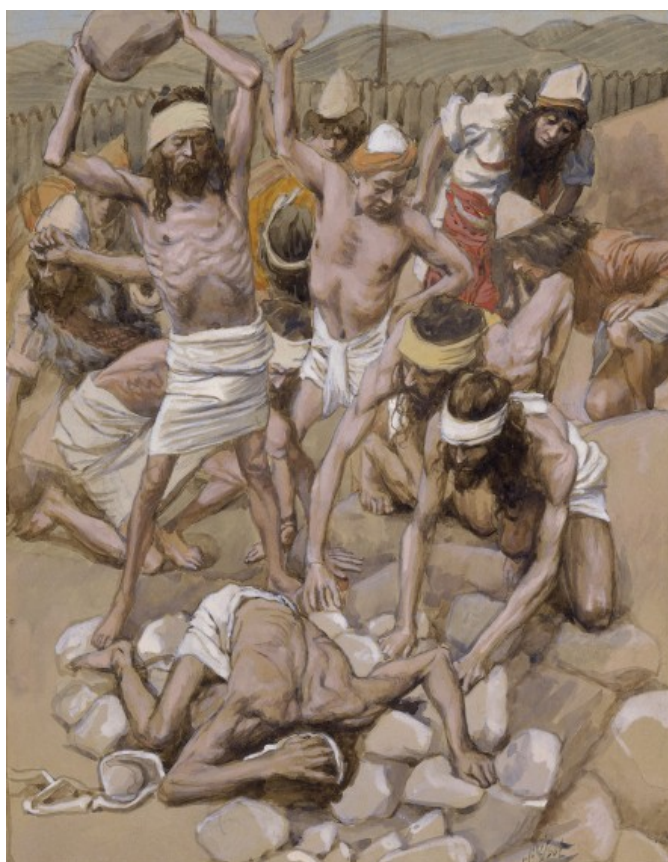
Hình minh họa kẻ phạm ngày Sa-bát bị ném đá [3], [4]

Chúng ta không biết lúc đó Ba-na-ba đang ở đâu, nhưng có lẽ Ba-na-ba không có mặt cùng chỗ với Phao-lô. Nếu không, thì cả Ba-na-ba cũng đã bị ném đá. Có thể lúc đó, Phao-lô và Ba-na-ba đã chia nhau đến các nhà khác nhau của những người đã tin nhận Tin Lành tại Lít-trơ để giảng dạy Lời Chúa cho họ.