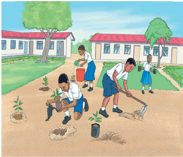
Picha namba 1

6. Chunguza picha zifuatazo kisha jibu maswali yanayofuata.