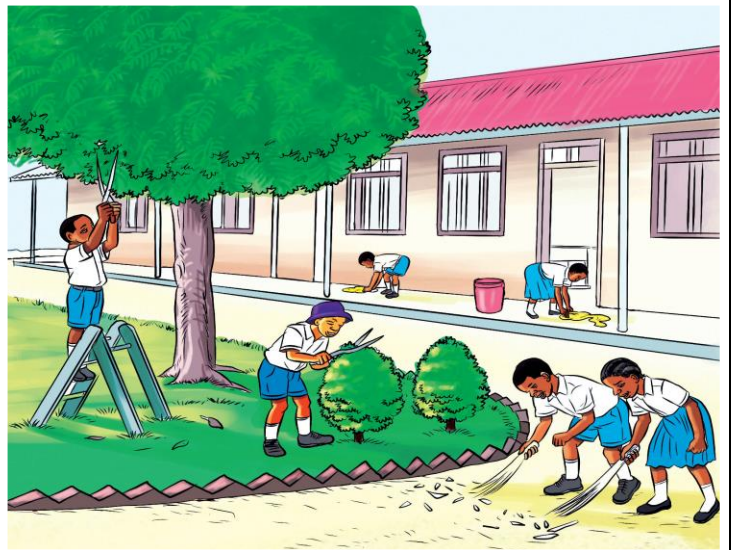
Picha namba 2